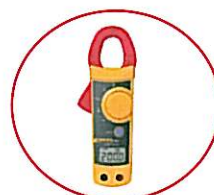
Fluke 322 クランプメーター