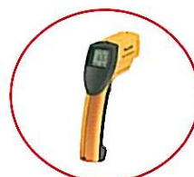
Fluke 63 放射温度計