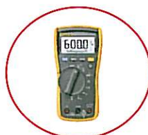
Fluke 115 マルチメーター

製品に同梱されている「ユーザー登録カード」に、ご購入頂いた製品のモデル名、購入日、購入販売店名をご記入頂き、空きスペースにシリアル番号とご希望のプレゼント名をお1つご記入の上、フルークまでご送付願います。